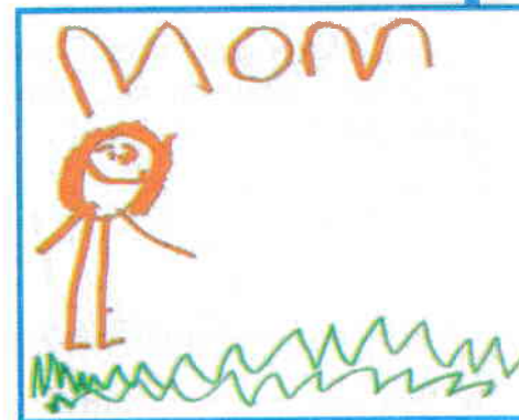
Lexi (3 ani), portret intențional

întrucât acesta trebuie să păstreze asemănarea cu subiectul real: foarte probabil